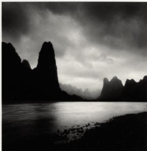
LJJIANG RIVER STUDY5 GUILIN, CHINA 2006

COOL: In what moment do you feel the urge like "wow, I want to take pictures of this"?