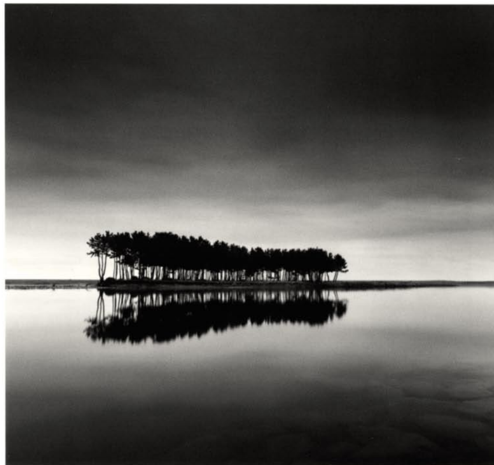
PINE TREES WOLCHEON GANGWANDO, SOUTH KOREA 2007