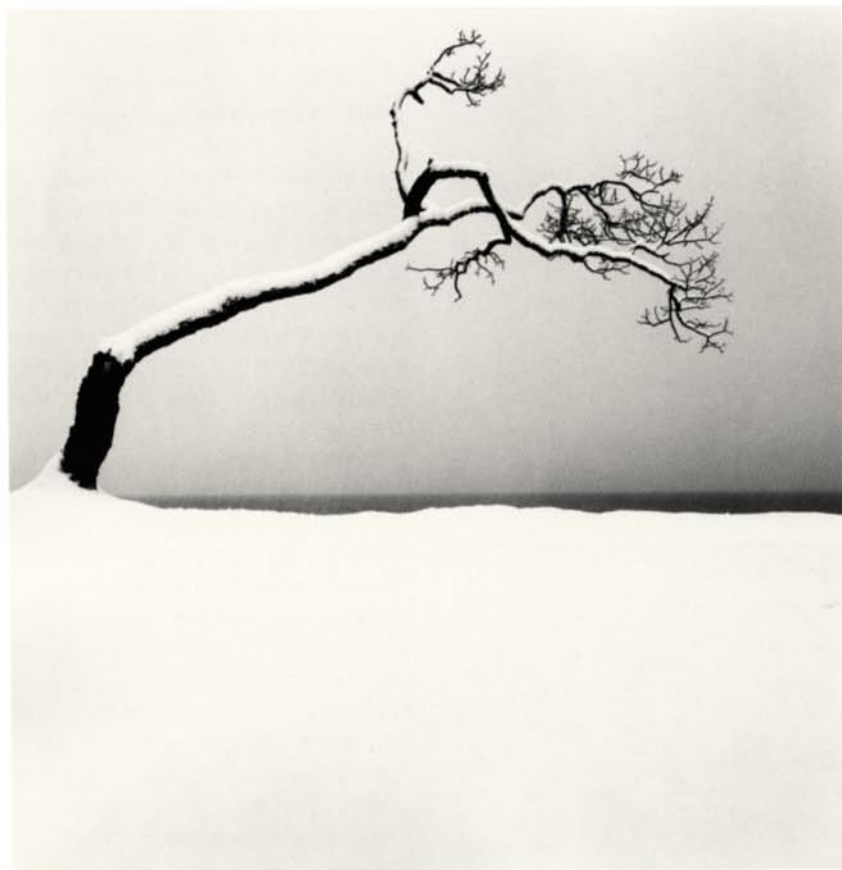
KUSSHARO LAKE TREE STUDY2 KOTAN HOKKAIDO, JAPAN 2005